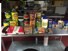
Thank you to all our parish members that donated items to support soup kitchen.